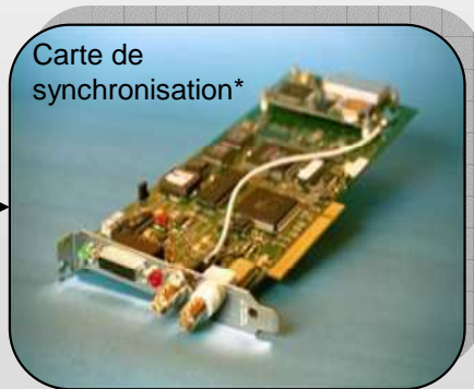
Carte de synchronisation*